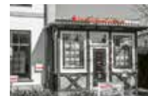
ImmobilienShop Graal-Müritz Kurstraße 1 18181 Graal-Müritz