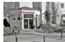
ImmobilienShop Kühlungsborn Strandstraße 43 18225 Kühlungsborn