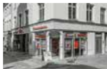
ImmobilienShop Kröpi Kröpeliner Straße 91 18055 Rostock