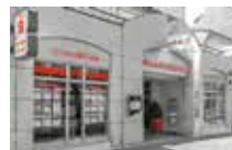
ImmobilienShop Warnemünde Mühlenstraße 27a 18119 Rostock