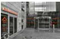
ImmobilienZentrum Rostock Am Vögenteich 23 18057 Rostock

Gebündelte Kompetenz rund um Ihre Immobilie.