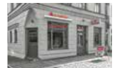
ImmobilienShop Güstrow Wachsbleichenstraße 11 18273 Güstrow

Der Gutschein ist gültig bis zum 30.06.2017 und nur in unseren ImmobilienShops innerhalb unseres Geschäftsgebietes. Bitte bringen Sie den Gutschein zur Einlösung mit in die Filiale.